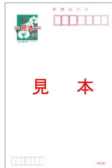
官製はがき(無地) 喪中用の官製はがきです 切手を貼らずにお使い頂けます 裏面には絵柄は入っておりません