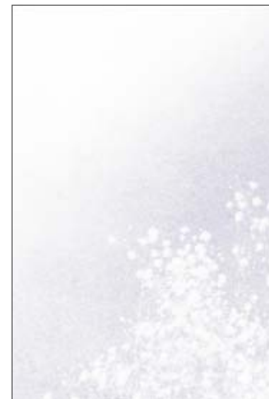
C:かすみ草 郵便枠: 赤 青色のグラデーションに白抜きで かすみ草のシルエット (切手を貼ってお使いください)