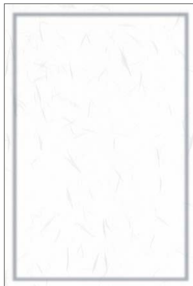
A:雲粋 郵便枠: グレー 高級感ある和紙に淡いグレーの粋付 こちらのみ1枚15円となります。 (切手を貼ってお使いください)

※ 実物をご覧になりたい場合は郵送にてサンプルをお送りさせていただきます。 電話・FAX・E-mailでお申込み下さい。