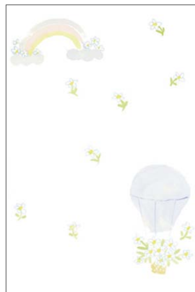
G:気球 郵便枠: グレー 全体にお花と気球のイラスト入り (切手を貼ってお使いください)