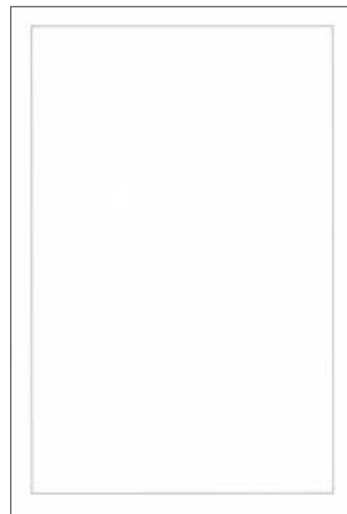
B:銀粋 郵便枠: グレー オーソドックスなグレーの粋付 (切手を貼ってお使いください)