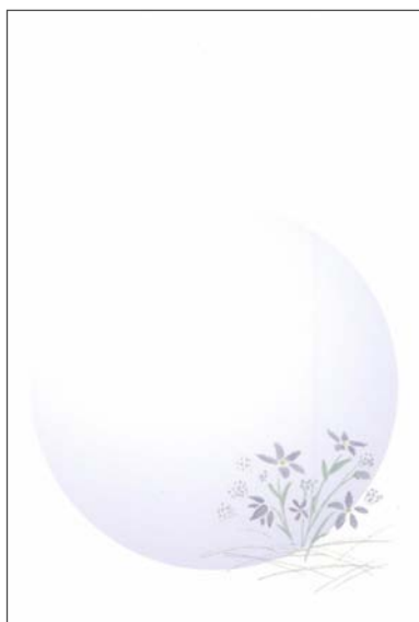
D:月とすみれ 郵便枠: グレー 薄紫の月を背景に右下に菫のイラスト (切手を貼ってお使いください)